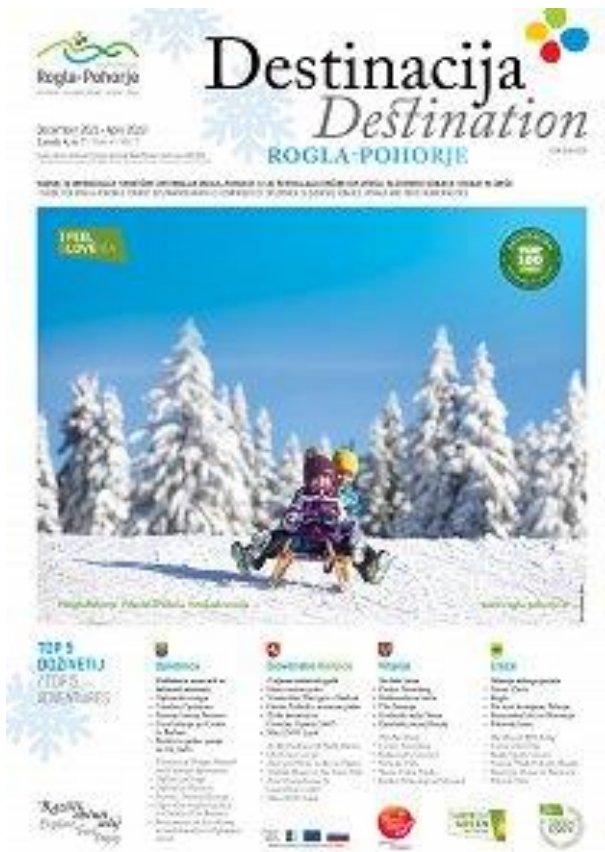
Slika 3: Zimska izdaja časopisa Destinacije Rogla-Pohorje (2021-2022)