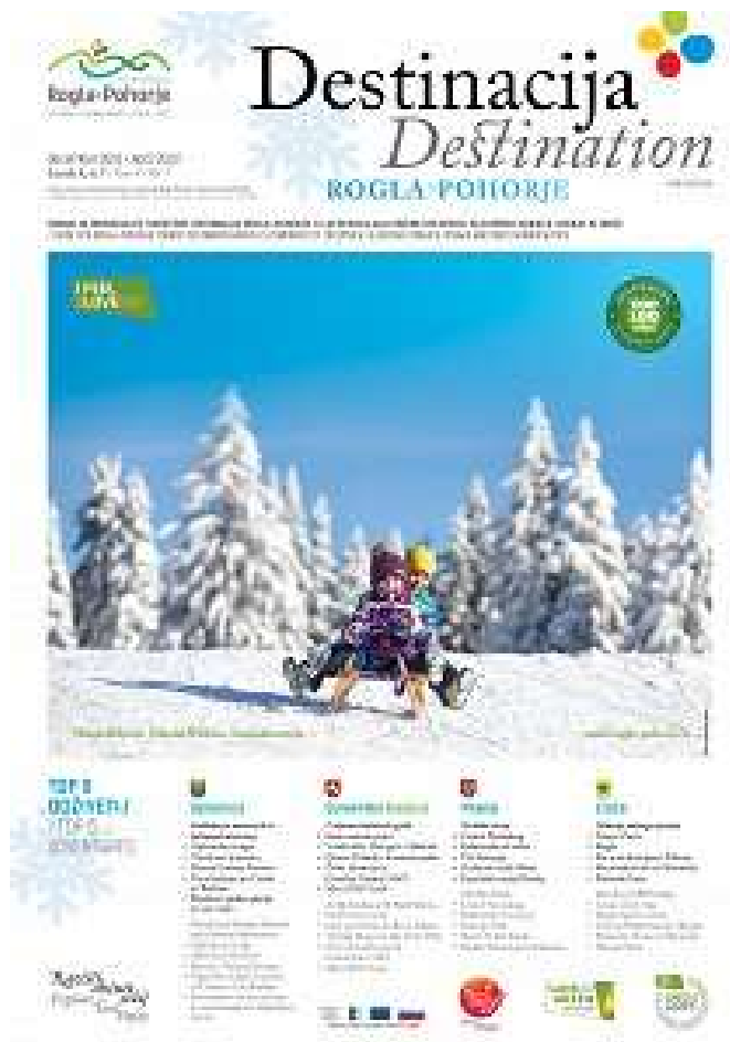
Slika 3: Zimska izdaja časopisa Destinacije Rogla-Pohorje (2021-2022)